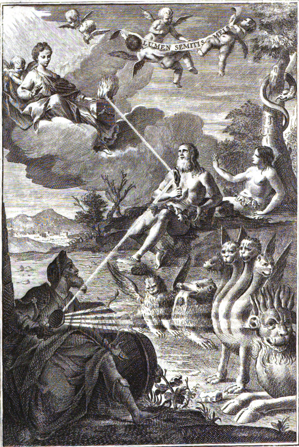
Petrus Solvini inv.